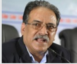
● पुष्पकमल दाहाल तत्कालीन प्रधानमन्त्री

नेपालको सन्दर्भमा सरकारी रेडियो, सामुदायिक रेडियो र निजी क्षेत्रका रेडियोले रेडियो प्रविधिकामा माध्यमबाट नेपाली जनताको सूचनाको हकको प्रवाहका लागि सरकारको मुख्य साभेदारका रूपमा भूमिका निर्वाह गर्दै आएका छन् । तिनले सूचनामा नागरिकको पहुँच बढाउनुको अलावा संघीय लोकतान्त्रिक गणतन्त्रको स्थापना, मानवअधिकार, विधिको शासन र शान्तिपूर्ण सामाजिक रूपान्तरणका लागि अहम् भूमिका खेलेका छन् । सामुदायिक रेडियो साँच्चिकै नागरिकको एउटा विशिष्ट जीवनशैली बनेको छ ।