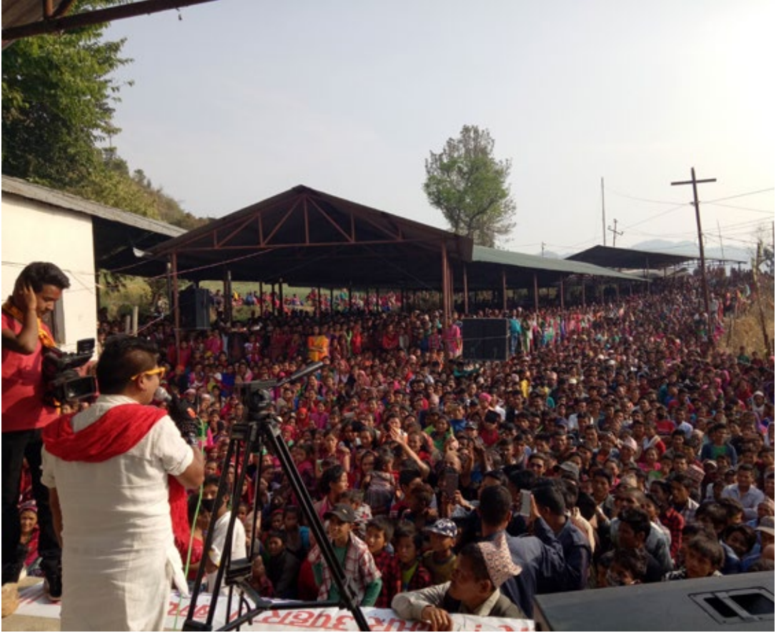
सल्यानस्थित रेडियो कपुरकोटको वार्षिकोत्सव समारोह ।

दिगो विकासको लक्ष्यमा सरकार, दातृ निकाय, गैरसरकारी संस्था सबै केन्द्रित भएको अवस्थामा सामुदायिक रेडियो कसरी साभेदार हुन सक्छन् ?